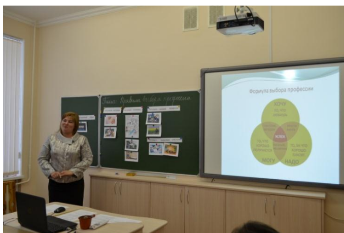
Фото 6. Групповая консультация «Куда пойти, или какую дверь открыть?»

Проведение групповых консультаций: «Куда пойти, или какую дверь открыть?» (Фото 6), «Аукцион профессий», просмотры и обсуждения кинофильмов (в которых отражаются события жизни людей разных профессий, где герои задумываются над выбором жизненного и профессионального пути), помогают обучающимся открыть причины своих трудностей самоопределения и одновременно находить варианты их решения и преодоления.