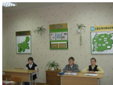
Фото 4. Кабинет профориентации

В кабинете представлены материалы о профилях трудовой подготовки в учреждении и за его пределами, квалификационные характеристики профессий доступных выпускникам вспомогательной школы-интерната, информация об учебных заведениях и предприятиях города и области, где возможно трудоустройство, справочная и методическая литература.