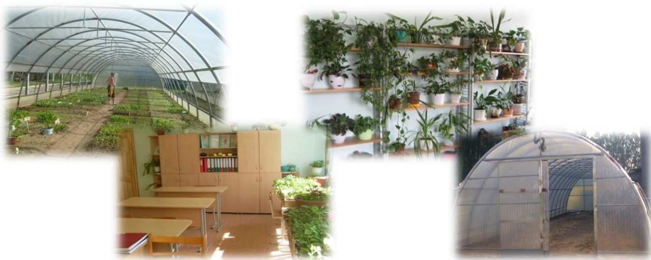
Фото 2. Учебные кабинеты трудового обучения

Занятия по растениеводству и животноводству проводятся в учебных кабинетах и учебной лаборатории, практические работы по основным темам программы учащиеся выполняют на пришкольном учебно-опытном участке и в учебных теплицах (Фото 2).