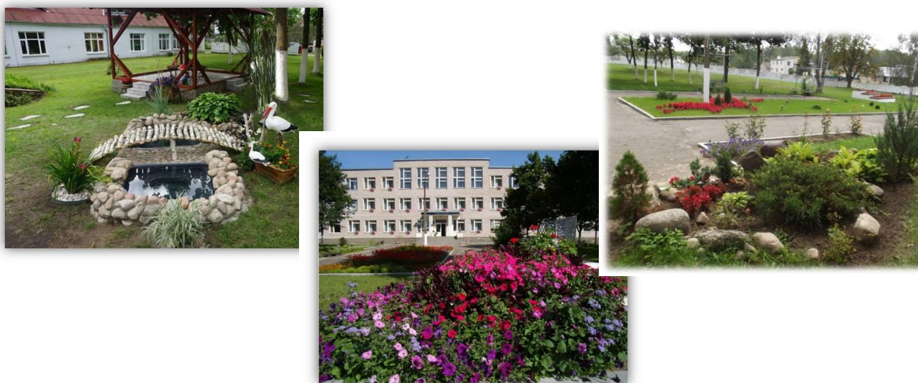
Фото 3. Оформление пришкольной территории

И как результат работы учащихся классов углубленной социальной и профессиональной подготовки – призовые места в смотре-конкурсе «Украсим Беларусь цветами», I место в районном этапе республиканского конкурса в номинации «Регулярный цветник» в 2018; III место в районном этапе республиканского конкурса в номинации «Тематический цветник «Моя весна, моя Победа» в 2019; II место в районном этапе областного смотра-конкурса благоустройства и озеленения территорий учреждений образования «Цвети, мой край!» в 2020 (Фото 3).