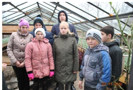
Фото 9. Экскурсия на производственный участок предприятия ПКУП «Волковысское коммунальное хозяйство»

Такие экскурсии оказывают положительное влияние на формирование интереса к профессии, так как сочетают в себе наглядность и доступность восприятия с возможностью анализировать, сравнивать, делать выбор. Они помогают учащимся соотнести свои профессиональные интересы и знания с новыми представлениями о профессиях, познакомиться с различными видами трудовой деятельности на предприятии, уточнить потребность в кадрах.