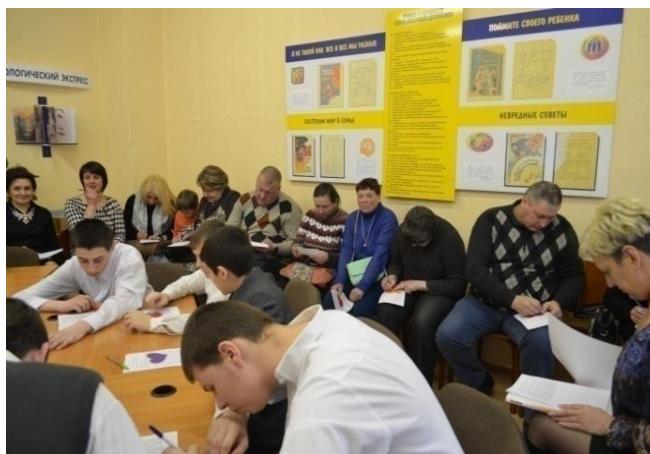
Фото 14. Заседание родительского клуба «Гармония»

практические рекомендации для родителей и сведения об учебных заведениях области (Приложение 5).