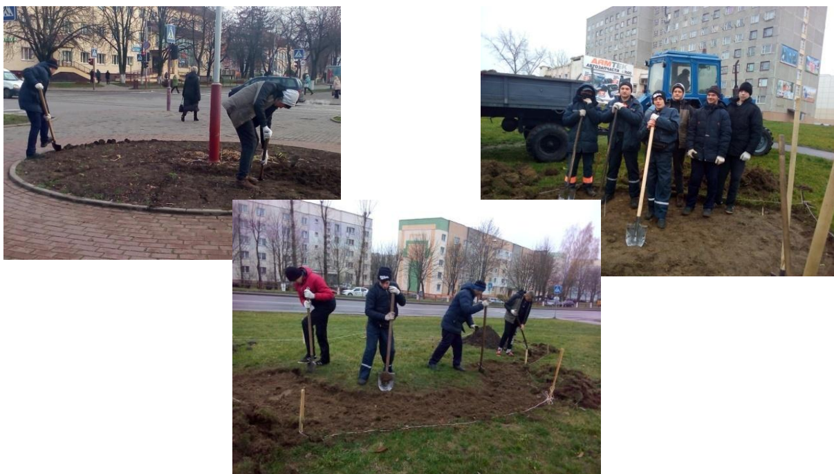
Фото 11. Профессиональная проба по профессии «Рабочий зелёного строительства»

При выполнении профессиональной пробы по профессии «Рабочий зеленого строительства. Цветовод» (Фото 11) учащиеся стали непосредственными участниками благоустройства города (высадка декоративных кустарников). Включение учащихся в трудовую общественно значимую деятельность, существенно изменяет их отношение к работе.