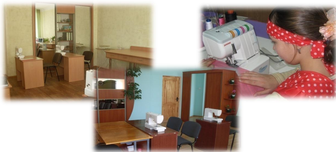
Фото 1. Мастерские по обработке тканей

В учреждении образования функционируют классы углубленной социальной и профессиональной подготовки, в которых одновременно с образовательной программой специального образования на уровне общего среднего образования для лиц с интеллектуальной недостаточностью реализуется образовательная программа профессиональной подготовки рабочих (служащих) по профессиям: «Швея», «Рабочий зеленого строительства. Цветовод», «Садовод. Овощевод».