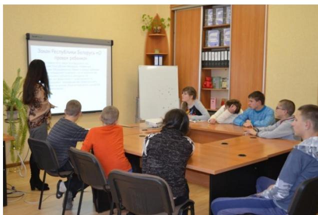
Фото 8. Консультация учащихся «Право на труд»

Консультации «Право на труд» (Фото 8), «Особенные гарантии для особенных людей», «В чём специфика трудоустройства человека с инвалидностью?» помогли расширить представления подростков о трудовых гарантиях, о юридических правах, а родителям получить профессиональное социально-педагогическое консультирование по запросу.